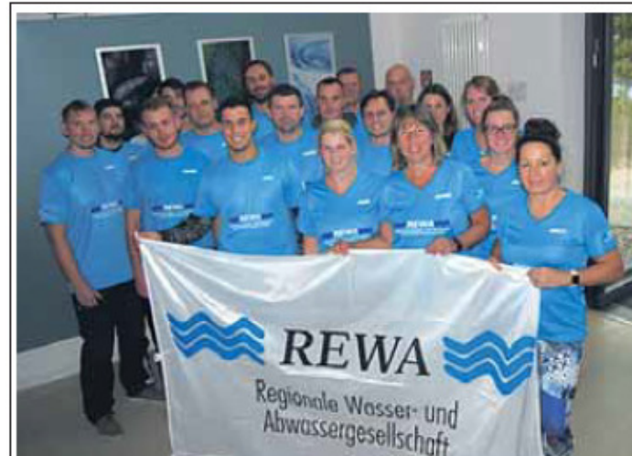
Rund 20 Mitarbeiter der REWA gingen gestern auf die einzelnen Strecken.