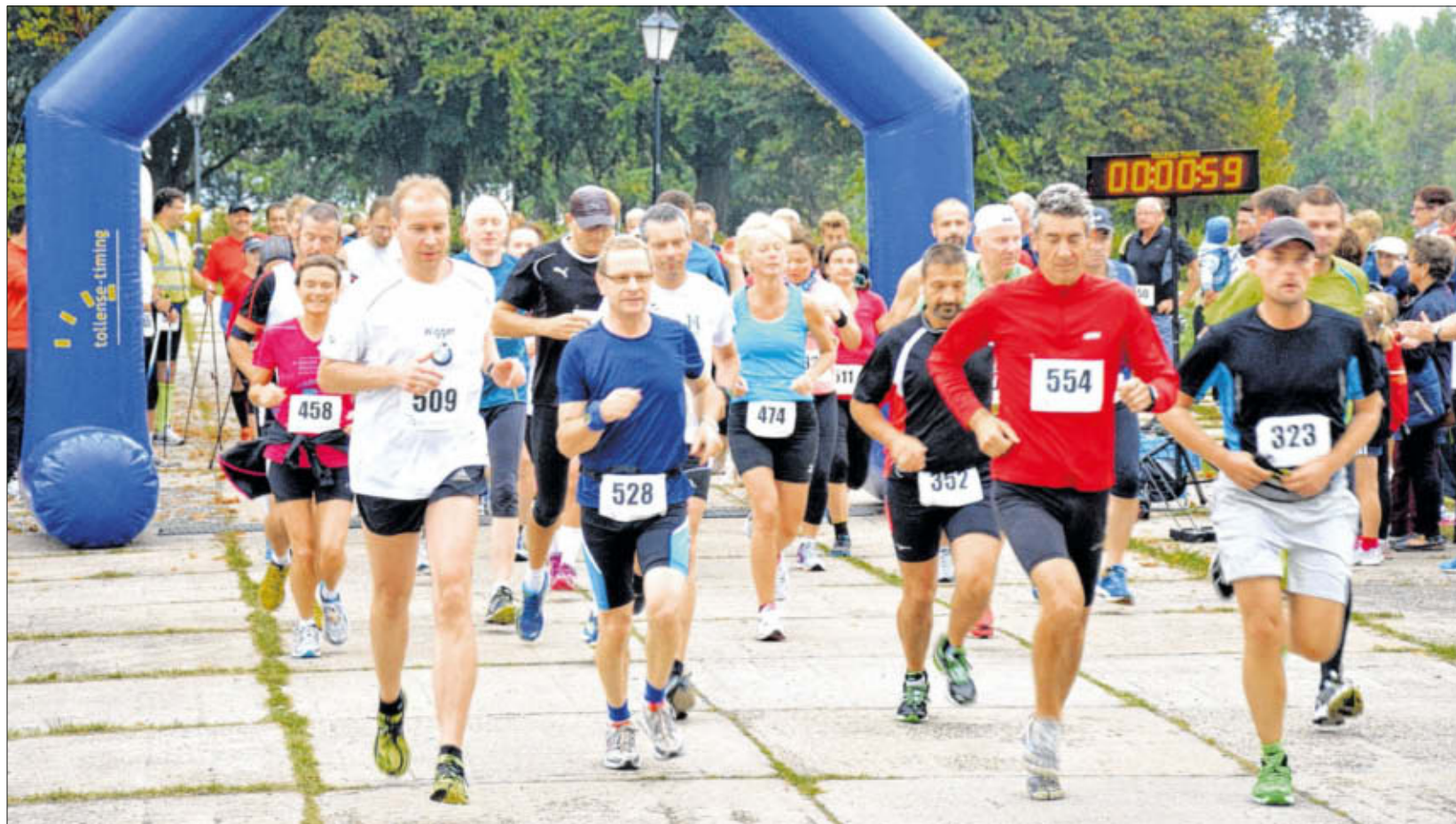
Besonders beliebte Strecke: Der 10-Kilometer-Lauf (hier der Start im letzten Jahr) führt von Klausdorf über Hohendorf und Wendisch-Langendorf nach Zarrenzin und wieder zurück an den Ausgangsort.

Auswählen können die kleinen und großen Sportfreaks aus drei Strecken, die sich in den letzten Jahren bewährt haben und deshalb auch nicht geändert werden. Da geht es 4,2 Kilometer von Klausdorf nach Prohn und wieder zurück. Die Zehn-Kilometer-Tour führt von Klausdorf nach Hohendorf, Wendisch-Langendorf bis nach Zarrenzin und wieder nach Klausdorf. Der lange Kanten - das sind 15 Kilometer - verläuft zuerst wie die Zehnerstrecke, führt aber weiter bis Barhöft und dann zum Ausgangsort zurück. Für die ganz Lütten gibt es den Landknirpse-Lauf, der am Klausdorfer Strand entlangführt. Alle Läufer starten um 10 Uhr.