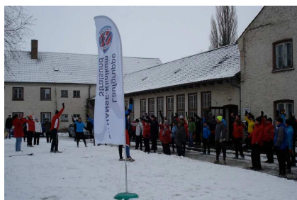
Gemeinsame Erwärmung vor dem Start.

Aus diesem Grund sucht unsere Lauf- und Walking-Gruppe neue Räumlichkeiten, wo wir uns einmal wöchentlich treffen können. Wer Ideen und Möglichkeiten für uns sieht, kann sich gerne jederzeit an uns wenden. Fotos von der Veranstaltung gibt es unter www.laufgruppe-stralsund.de .