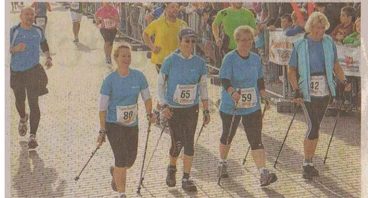
Der Spaß am Walken steht diesen Frauen ins Gesicht geschrieben: Sie starteten für den SV Turbine Neubrandenburg.