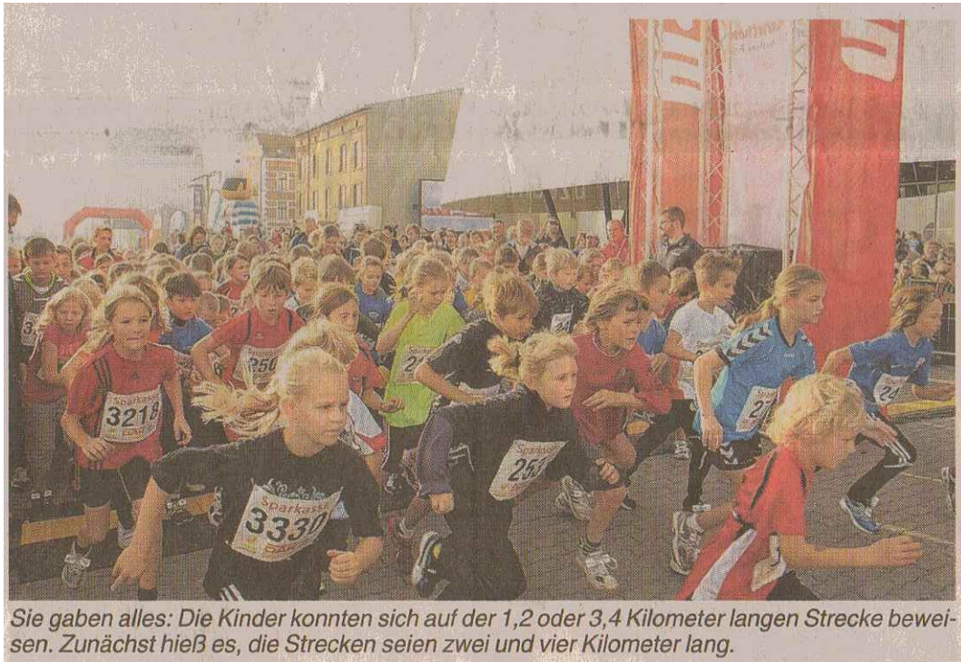
Sie gaben alles: Die Kinder konnten sich auf der 1,2 oder 3,4 Kilometer langen Strecke bewiesen. Zunächst hieß es, die Strecken seien zwei und vier Kilometer lang.