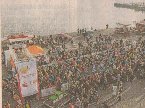
Aus der Vogelperspektive: Das fast 800 Teilnehmer starke Läuferfeld macht sich auf die 10,5 Kilometer lange Strecke.