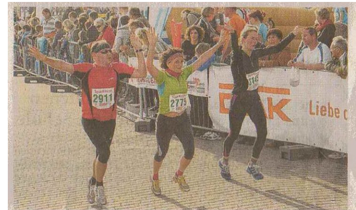
Im Zieleinlauf gab es viele Emotionen. Manche Teilnehmer kamen ermattet an, andere schienen zu schweben.