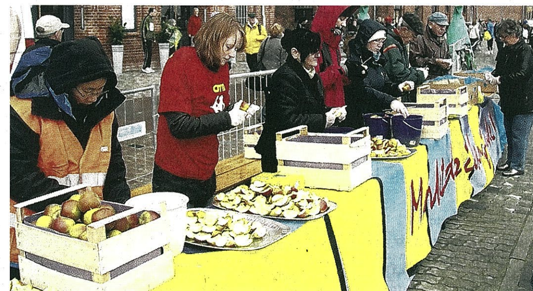
700 Kilogramm Bananen und 550 Kilogramm Äpfel werden für die Läufer im Zielbereich sowie an den Versorgungsstationen bereitgestellt.