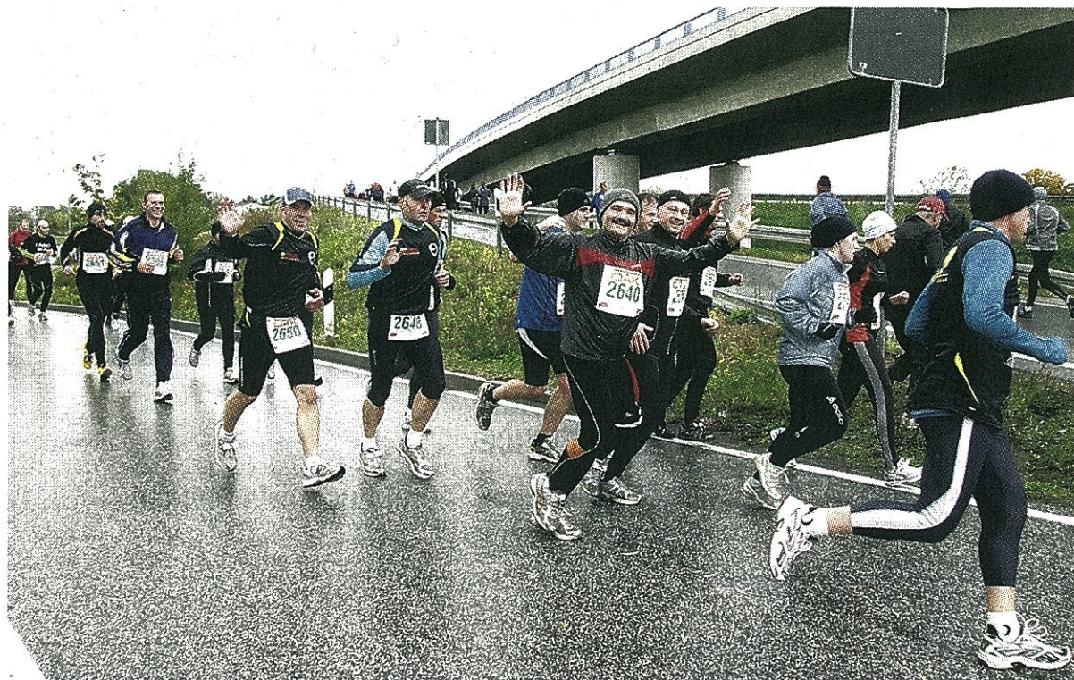
Gute Laune trotz des schlechten Wetters: Kurz nach dem Start des 12-Kilometer-Laufes fängt es an zu regnen. Diese Läufer, die sich gerade auf dem Weg zur Brücke befinden, stört das nicht.